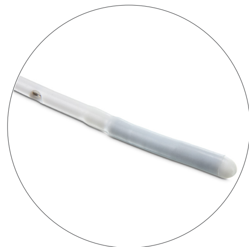
Extremo distal cerrado con orificios laterales.