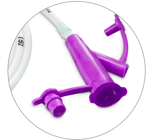
Mandril semi-rígido, facilita la colocación.